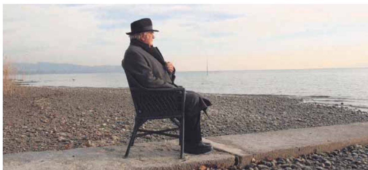
Martin Walser und „sein“ See.